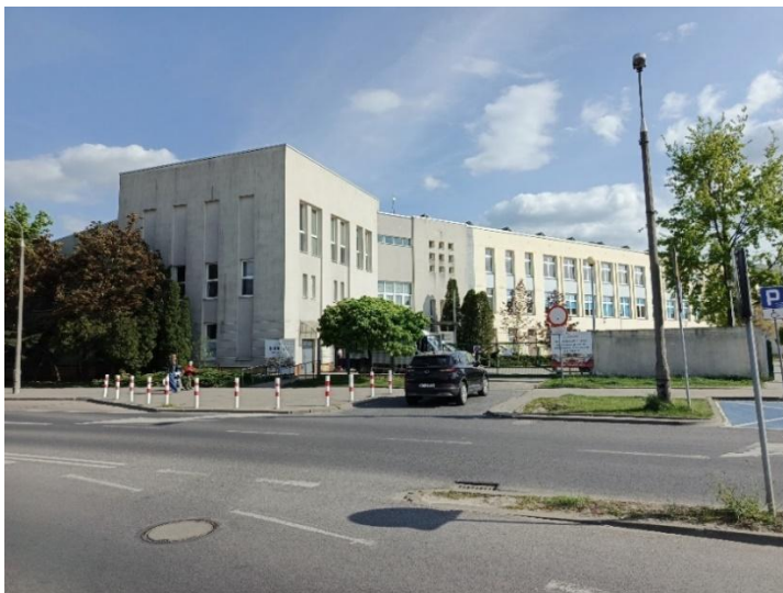
Zdjęcie 2 Wykonane od strony ulicy Czwartaków – wejście główne.