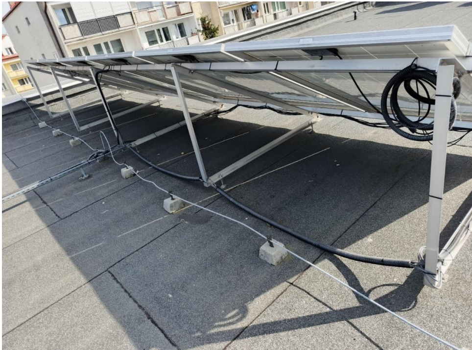
Zdjęcie 8. Konstrukcja fotowoltaiczna.