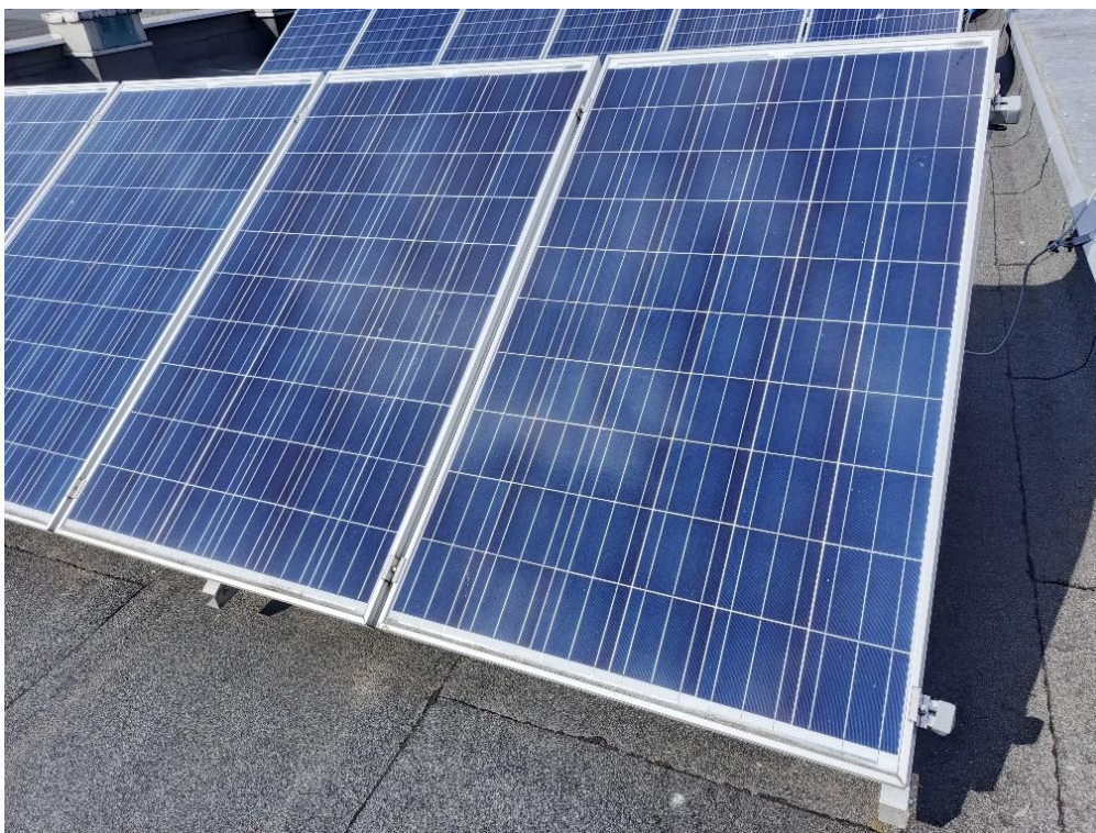
Zdjęcie 9 Konstrukcja fotowoltaiczna klemy.

Obecnie zamontowane moduły fotowoltaiczne posiadają wymiary 983x1670 mm, dobrane przez oferenta mogą posiadać większy rozmiar, dopuszcza się zwiększenie rozmiaru profili mocujących z pomocą specjalnych wsporników montowanych za pomocą śrub. (rysunek wspornika zamieszczono w dalszej części).