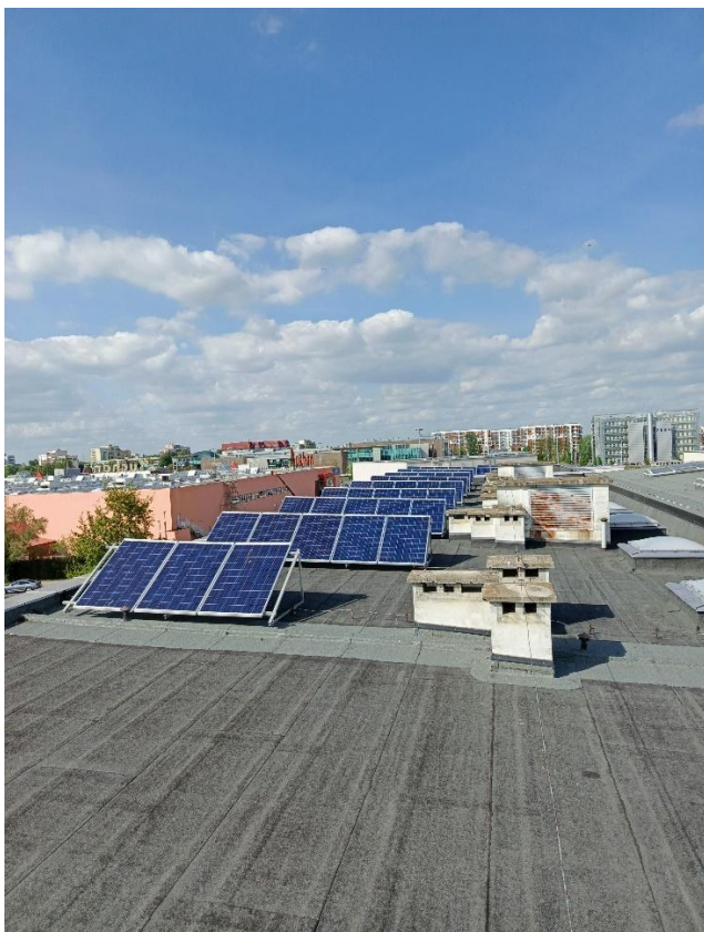
Zdjęcie 6. Wykonane od strony zachodniej 51 modułów dach basenu.

Przedmiotem opisu technicznego jest określenie wymagań dotyczących wymiany modułów instalacji fotowoltaicznej do produkcji energii elektrycznej, w taki sposób, żeby zwiększyć moc do 70,00 kWp (powyżej 70,00 kWp z tolerancją -2%) wraz z wymianą okablowania instalacji oraz wykonaniem kompleksowej