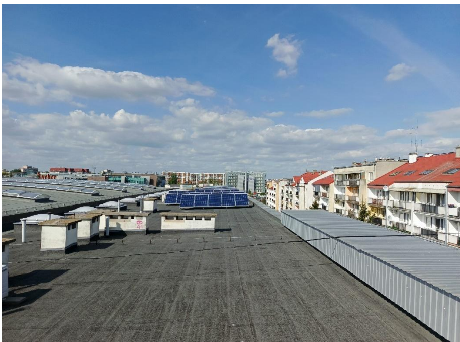
Zdjęcie 5. Wykonane od strony wschodniej 51 modułów dach basenu.