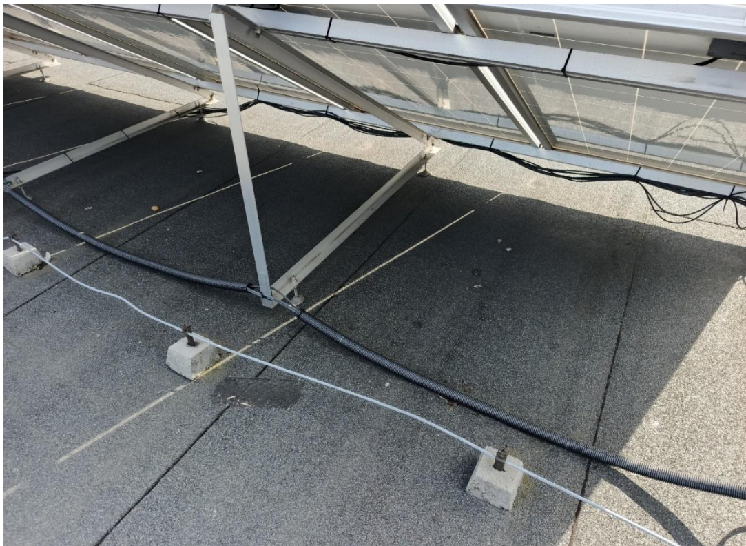
Zdjęcie 7. Konstrukcja fotowoltaiczna.

Istniejącą konstrukcja wsporczą modułów fotowoltaicznych jest umieszczona na dachu płaskim Basenu Podolanka i Szkoły Podstawowej nr 23 pokrytym papą. Jako załącznik dołączmy dokumentację konstrukcji wsporczej. Obecna konstrukcja jest mocowana do dachu za pomocą kotwy chemicznej, moduły fotowoltaiczne są przymocowane za pomocą klem do typowych profili aluminiowych wykorzystywanych w fotowoltaice o wymiarze 40x40 mm, (rysunek profilu w załączeniu w dalszej części dokumentacji). Profile są przymocowane do trójkątów wykonanych z kątownika aluminiowego.