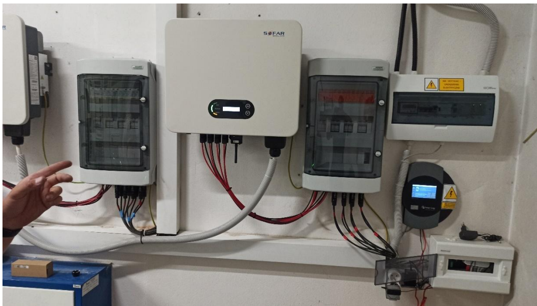
Zdjęcie 10 Zainstalowane falowniki Sofar Solar.

Obecna instalacja została zaprojektowana na dwóch falownikach Sofar Solar KTL25 G3 – Karta katalogowa w załączeniu. Nie przewiduje się wymiany falowników. Należy tak dobrać moduły fotowoltaiczne, żeby zoptymalizować możliwości produkcji energii elektrycznej za pomocą falowników. Falowniki są przyłączone w rozdzielni głównej za pomocą do dwóch przyłączy energetycznych o mocy 70 kW każdy.