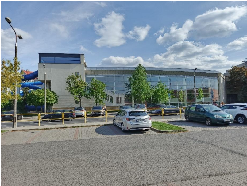
Zdjęcie 1 Wykonane od strony ulicy Czwartaków - Północnej.

Przedmiot zamówienia obejmuje, demontaż obecnie zainstalowanych 152 modułów fotowoltaicznych o łącznej mocy 40 kWp przyłączonych za pomocą dwóch falowników do dwóch PPE, dostawę i montaż modułów fotowoltaicznych o mocy do 70,00kWp (powyżej 70,00kWp z tolerancją -2%) umieszczonej na istniejącej konstrukcji wsporczej wraz z wykonaniem nowego okablowania instalacji na dachu Pływalni Miejskiej Podolanka przy ul. Czwartaków 6, 09-410 Płock, działka nr 494/13. Obiekt, na którym znajduje się przewidziana do rozbudowy instalacja fotowoltaiczna przedstawiają załączone poniżej zdjęcia: